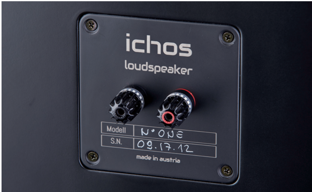
Hochwertige WBT-Nextgen-Klemmen sorgen für einen perfekten Anschluss

höhere Lautstärke reagierten. Selbst bei höchsten Pegeln blieb der Bass sauber und akzentuiert, aber auch bei hohen Tönen erfreute die Ichos mit einer luftigen und räumlich präzisen Wiedergabe. Das Dipol-Konzept des Hochtöners scheint der richtige Ansatz zu sein. Begeistert von der schier grenzenlosen Dynamik habe ich den genannten Song unzählige Male gehört, bevor ich das Musikmaterial in Richtung Klassik wechselte.