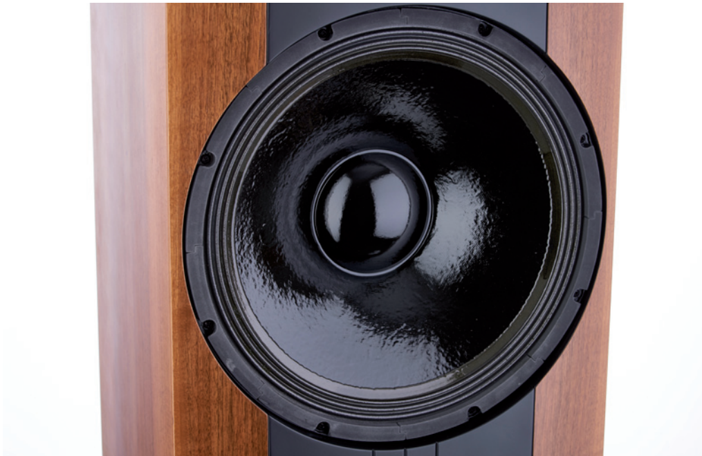
Gut zu sehen ist hier die mit Öl und einer dreimal aufgetragenen Lackschicht aus Geigenbaulacken behandelte Membran des 38 Zentimeter großen Bass-Mitteltöners

bronze geordert werden. Mein Testexemplar war furniert mit heimischen Nussbaum. Das Gehäuse der Ichos N° ONE besteht an der Frontseite und oben aus 38 Millimeter starkem MDF, die Seiten- und Rückwände sind 19 Millimeter dick und ebenfalls aus MDF gefertigt. Zur Versteifung des Gehäuses sind an der Rückseite diverse Querleisten aus Birkenmultiplex verleimt. Die Hauptsteifigkeit wird jedoch durch das verleimte Horn aus Multiplex erreicht. Die Fertigung dieses Horns ist eine echte Herausforderung für den Tischler, denn dabei kommt es auf die strikte Einhaltung von engsten Toleranzen an. Die Produktion der Gehäuse überlässt Robert Rothleitner daher einem Spezialisten aus der Steiermark, der auch ausgefallene Kundenwünsche realisieren kann und auf eine langjährige Tradition im Lautsprechergehäusebau zurückblickt.