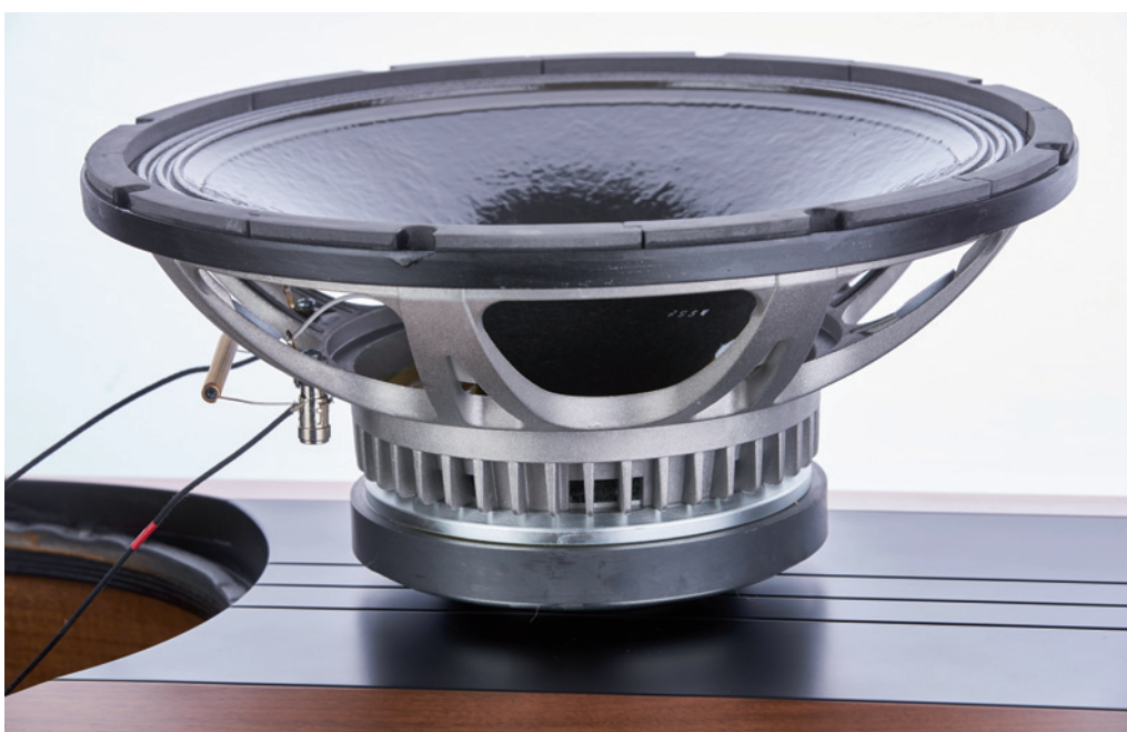
Der mächtige 38 Zentimeter große Bass-Mitteltöner wiegt alleine bereits 13 Kilogramm. Das Ausgangschassis wird durch andere Sicken, einen geänderten Spulenabstand und andere Magneten veredelt

Die Living-Stereo-Produktion des Boston Symphonie Orchesters mit Charles Munch und Camille Saens Symphonie Nr. 3 in C Dur, Opus 78 erschien mir das richtige Kontrastprogramm. Agadio und Forte Passagen, Streicher, Querflöten, Blechbläser und auch Trommeln geben sich hier ein munteres Stelldichein. Hier sind also auch sehr feingeistige Qualitäten gefragt. Die Ichos N° One zeigte, dass sie auch dieses Metier sehr gut