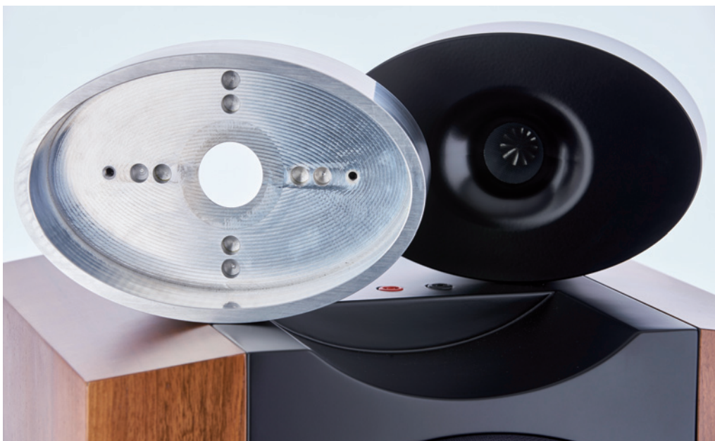
Der aus dem vollen gefräste Ellipsenkörper für den Hochtöner. Links die Ausgangsbasis des Monoblockgehäuses und rechts die lackierte Endversion mit dem als Dipol ausgelegtem Kompressionstreiber

bronze geordert werden. Mein Testexemplar war furniert mit heimischen Nussbaum. Das Gehäuse der Ichos N° ONE besteht an der Frontseite und oben aus 38 Millimeter starkem MDF, die Seiten- und Rückwände sind 19 Millimeter dick und ebenfalls aus MDF gefertigt. Zur Versteifung des Gehäuses sind an der Rückseite diverse Querleisten aus Birkenmultiplex verleimt. Die Hauptsteifigkeit wird jedoch durch das verleimte Horn aus Multiplex erreicht. Die Fertigung dieses Horns ist eine echte Herausforderung für den Tischler, denn dabei kommt es auf die strikte Einhaltung von engsten Toleranzen an. Die Produktion der Gehäuse überlässt Robert Rothleitner daher einem Spezialisten aus der Steiermark, der auch ausgefallene Kundenwünsche realisieren kann und auf eine langjährige Tradition im Lautsprechergehäusebau zurückblickt.