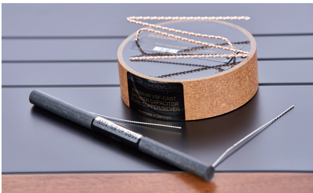
Gegen Aufpreis ist die N° One auch mit den DUELUND COHERENT AUDIO Kondensatoren erhältlich, die zu den weltbesten gehören

beherrscht. Streichinstrumente zeigten hier den nötigen Schmelz, der die Wiedergabe authentisch erscheinen lässt. Dass die Ichos Trommeln gut wiedergeben würde, hatte ich erwartet, aber auch Blechbläser hatten den richtigen Biss ohne bei lauten Passagen zu nerven. Die Tiefenstaffelung der Ichos gefällt mir gut, wobei ich die Abbildung in der Breite sogar noch etwas besser finde. Hier geht es oftmals noch über die Lautsprecher hinaus. Beim Übergang von langsamen Adagio Passagen zu Fortissimo kann die Ichos ihre überragenden Qualitäten in der Dynamik sehr gut ausspielen. Auch bei großorchestralen Einsatz verliert sie niemals den Überblick und bildet kleine Schallereignisse auch in der räumlich richtigen Größe ab.