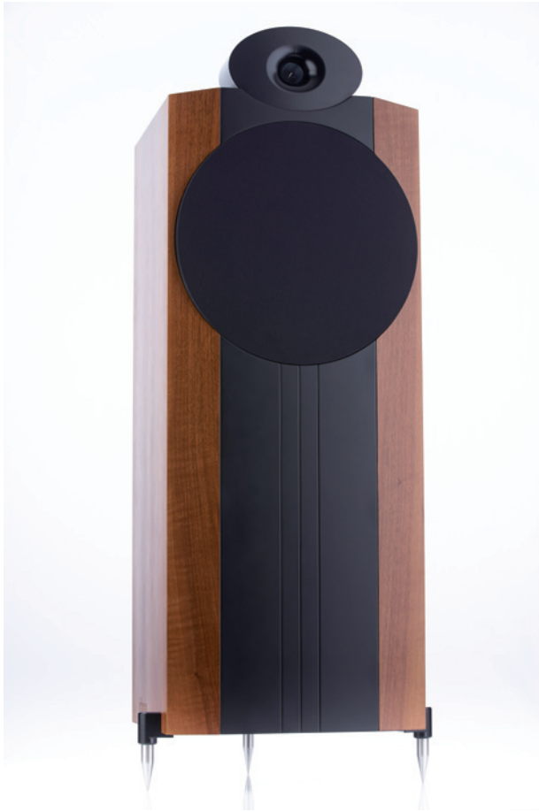
Trotz der Breite, die vor allem der Größe des 38 Zentimeter großen Tief-Mitteltöners geschuldet ist, wirken die Ichos Lautsprecher elegant und bereichern den Wohnraum positiv

ELUND COHEREND AUDIO, deren Kondensatoren anerkanntermaßen zu den weltbesten zählen. Was liegt da näher, als solche Edelkomponenten auch in die eigenen Lautsprecher einzubauen? Das mir vorliegende Testexemplar profitierte schon von dieser Partnerschaft, da hier bereits die Innenverkabelung von DUELUND stammte. Diese wirkte sich, wie Robert Rothleitner versicherte, in einem deutlich dynamischeren Klang im Vergleich mit den bislang verwendeten Kabeln eines bekannten schwedischen Herstellers aus. Darüber hinaus wird die N° ONE in der absoluten Topversion gegen Aufpreis auch noch komplett mit DUELUND-Kondensatoren bestückt.