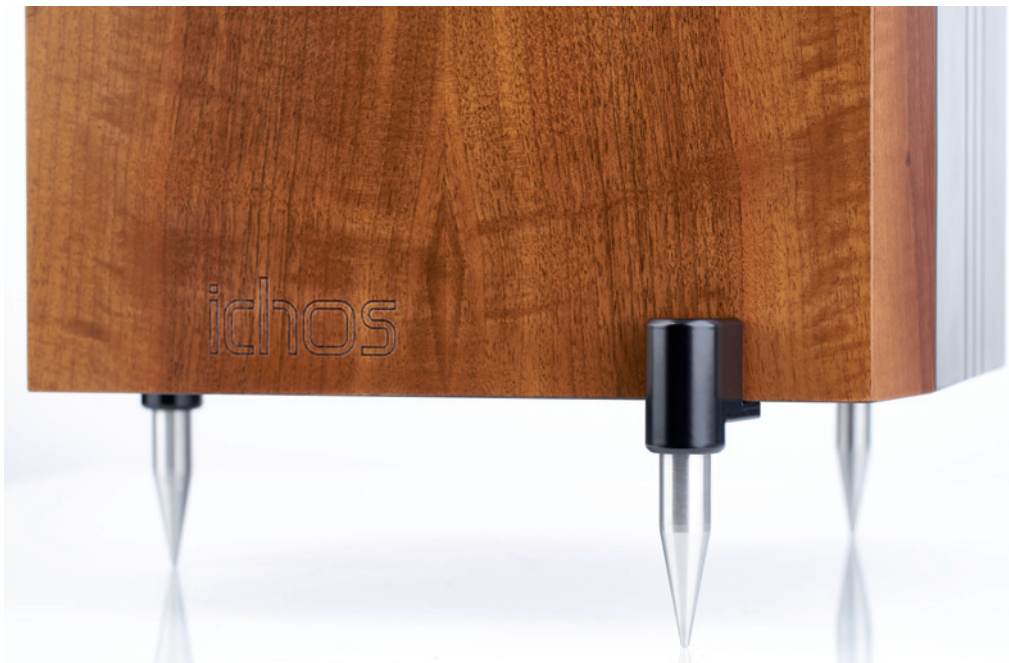
Zur Entkoppelung steht die Ichos N° ONE auf Edelstahl-Füßen. Die Farbe der hier schwarzen Ankkoppelung an das Gehäuse kann frei gewählt werden

in der Lage sein, eine verzerrungsfreie Wiedergabe und optimale Abstrahlung bis sechs Kilohertz zu gewährleisten. Beim Hochtöner kommen hochwertige Kondensatoren zum Einsatz, in der etwas teureren Version N° ONE SE in der gesamten Weiche sogar DUELUND-Kondensatoren. Damit die Verbindung zum Verstärker bestmöglich gelingt, spendierte man der Ichos N° ONE die anerkannt guten WBT-Nextgen-Lautsprecher-Terminals.