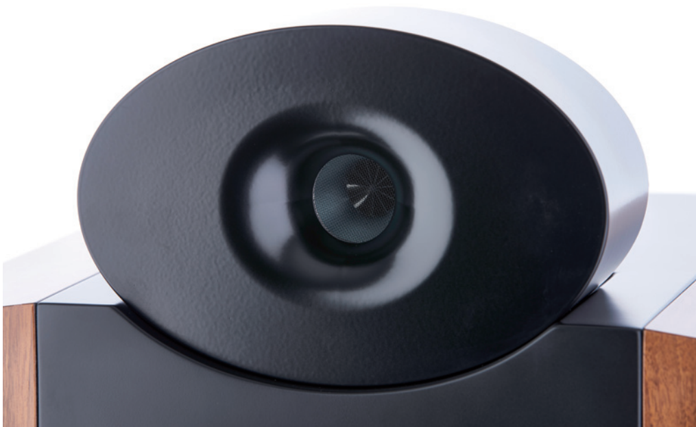
Der Waveguide des als Dipol ausgelegten Hochtöners ist unsymmetrisch und soll stehende Resonanzen am Austritt nahezu völlig reduzieren

Generell sind alle Ichos Schallwandler individuell gestaltbar. Der Fantasie sind hier kaum Grenzen gesetzt. Customizing ist das Zauberwort der Wiener Manufaktur. So sind neben diversen Holzfurnieren auch alle Farben für die Individualisierung der Lautsprecher und die Abstimmung auf den Wohnraum möglich. Das betrifft nicht nur den Korpus sondern auch Spikes oder das Gehäuse der Hochtoneinheit. Neben der Farbgestaltung kann diese auf Wunsch und Aufpreis statt dem aus dem vollen gefrästen Aluminium sogar aus Glocken-